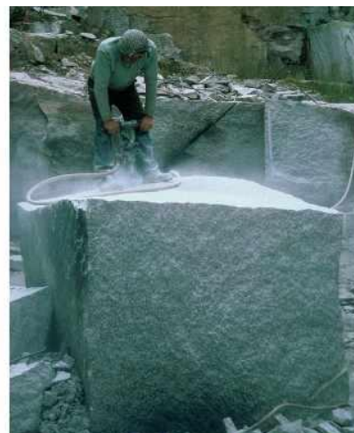
Carrières de granit à Saint-Germain-de-Modéon

Nos projets et services évoluent pour vous apporter toujours plus de satisfaction. Découvrez dans cette lettre d'informations quelques nouveautés mises en œuvre par l'office de tourisme et le service tourisme de la communauté de communes de Saulieu.