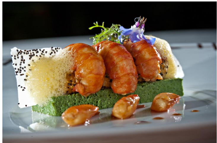
Saulieu, haut lieu gastronomique en Bourgogne