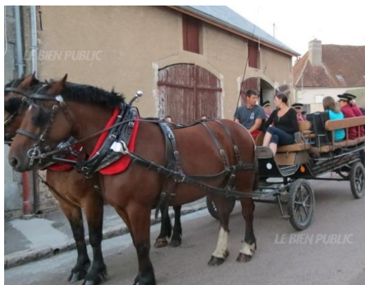
Balades en calèche